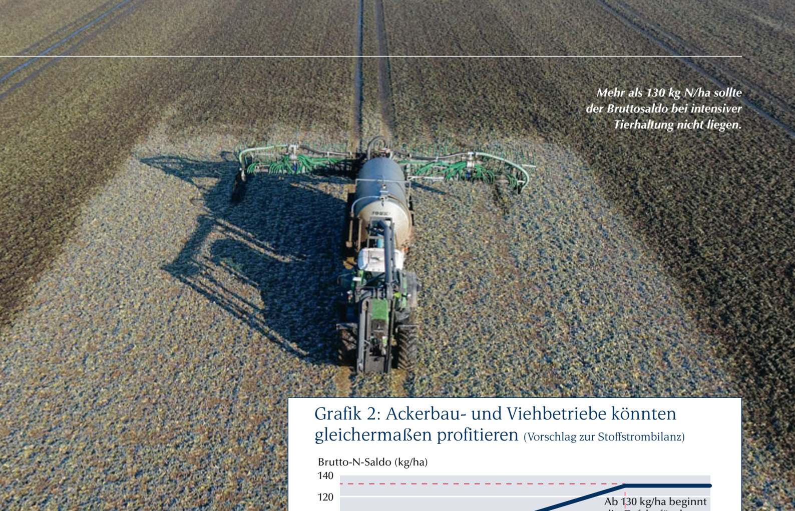
Grafik 2: Ackerbau- und Viehbetriebe könnten gleichermaßen profitieren (Vorschlag zur Stoffstrombilanz)

Mehr als 130 kg N/ha sollte der Bruttosaldo bei intensiver Tierhaltung nicht liegen.